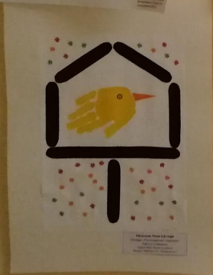
Птичка 3,8 года Воспитатель: [unreadable]