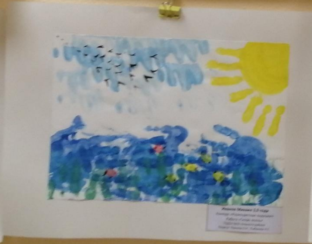
Анастасія Аніщенко, 2,10 років Матеріал: акрилові фарби Тема: Осінь Цікаво, як ви малювали? Як ви використовували фарби? Як ви використовували фарби?