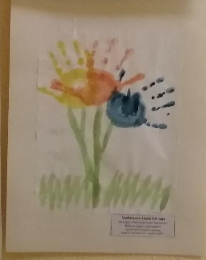
Творчество Анастасии 3,8 года Воспитатель: [unreadable]