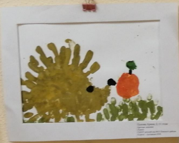
Світлана Агієва, 2,10 років Матеріал: акрилові фарби Тема: Осінь Цікаво, як ви малювали? Як ви використовували фарби? Як ви використовували фарби?