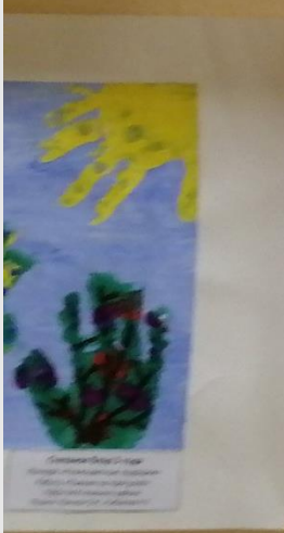
Світлана Агієва, 2,10 років Матеріал: акрилові фарби Тема: Осінь Цікаво, як ви малювали? Як ви використовували фарби? Як ви використовували фарби?