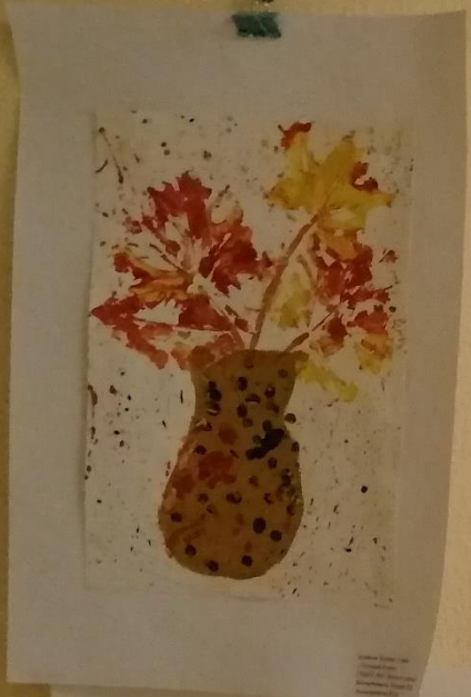
Создано в детском саду на занятии по рисованию в группе "Золотая осень" воспитатель: [unreadable]