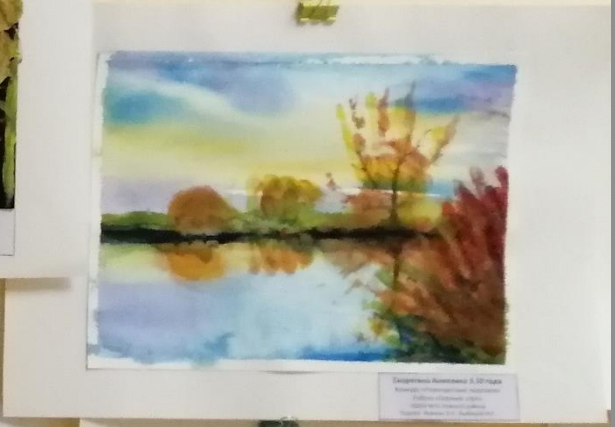
Сказочный пейзаж 3,10 года Воспитатель: [unreadable]